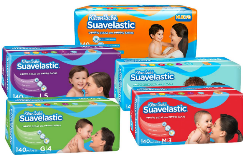
Suavelastic Etapa 3,4,5,6,7 de 40 pzs.