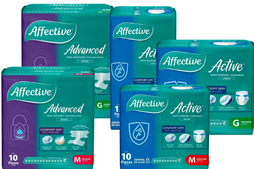
Affective Advanced Med. y Gde. 10 pzs. / Affective Active Ch. 12 pzs., Med. y Gde. 10 pzs.