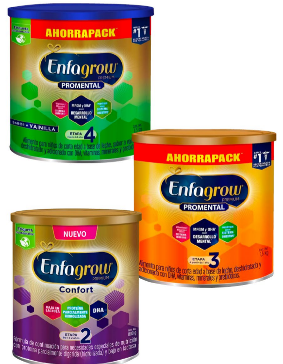
Enfagrow Promental Etapa 3 de 1.5 Kg. / Enfagrow Promental Etapa 4 de 1.5 Kg. / Enfagrow Confort Etapa 2 de 800 g.